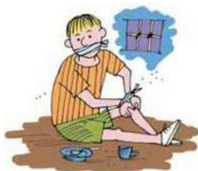
Если вы попали в заложники

Террористические акты бывают нескольких видов: захват заложников, угоны транспортных средств вместе с пассажирами, взрывы.